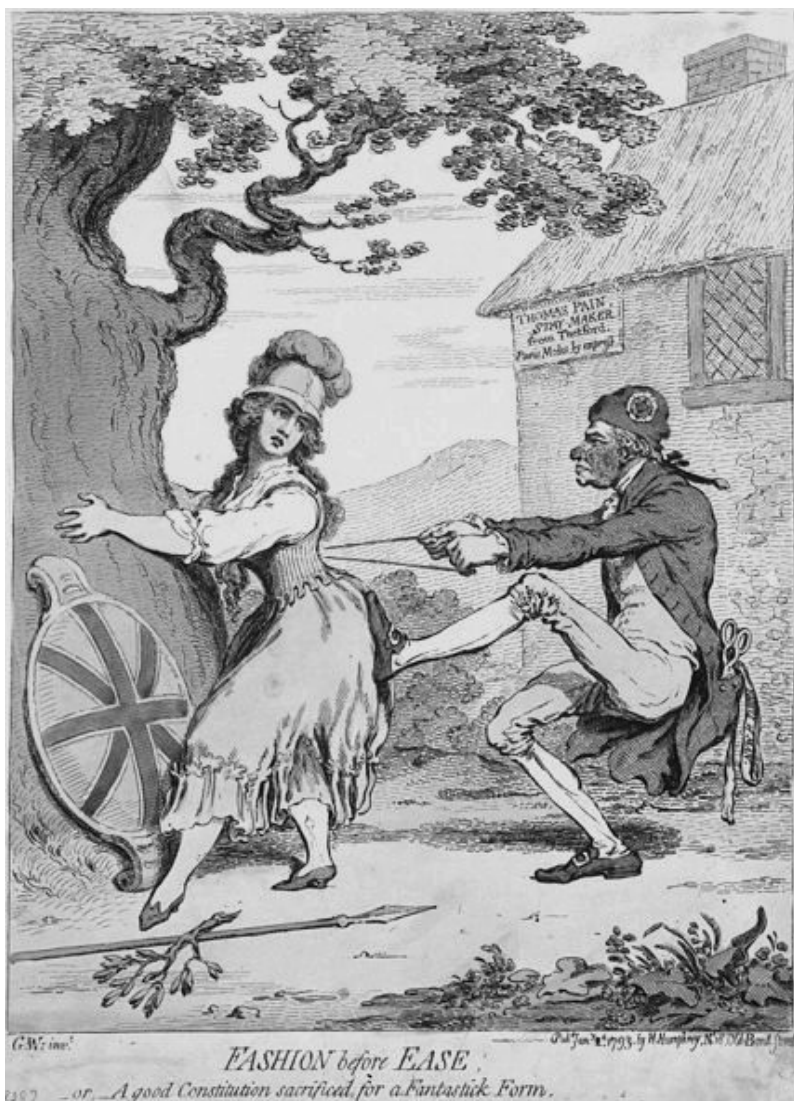
Καρικατούρα του 1793: Ο Τόμας Πέιν σφίγγει τον κορσέ της Αγγλίας.